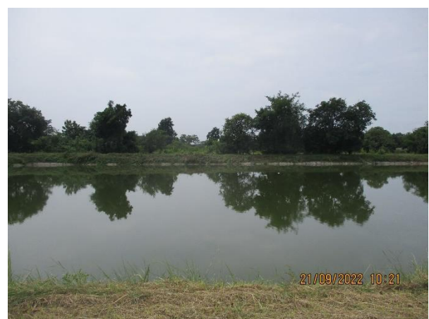
รูปที่ 20 บ่อหน่วงน้ำฝน