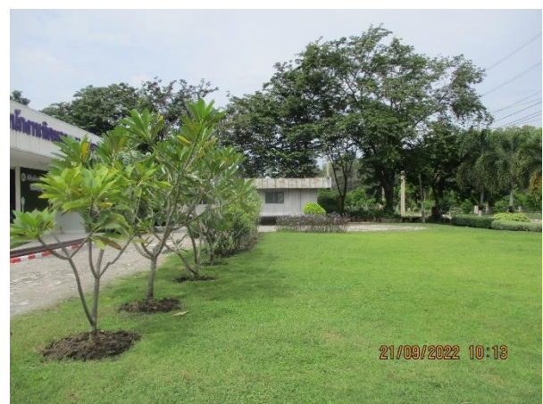
รูปที่ 30 พื้นที่สีเขียวภายในนิคมฯ