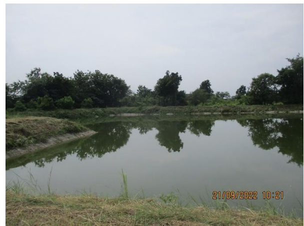
รูปที่ 18 บ่อเก็บน้ำดิบ