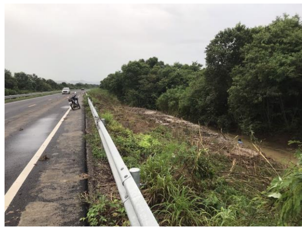
รูปที่ 36 การขุดลอกคลองสองคอน