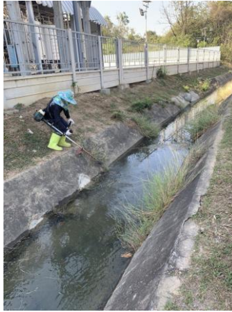
รูปที่ 35 การกำจัดวัชพืชบริเวณรางระบายน้ำ