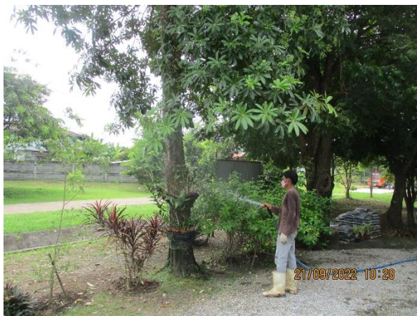
รูปที่ 10 การรดน้ำต้นไม้พื้นที่สีเขียว