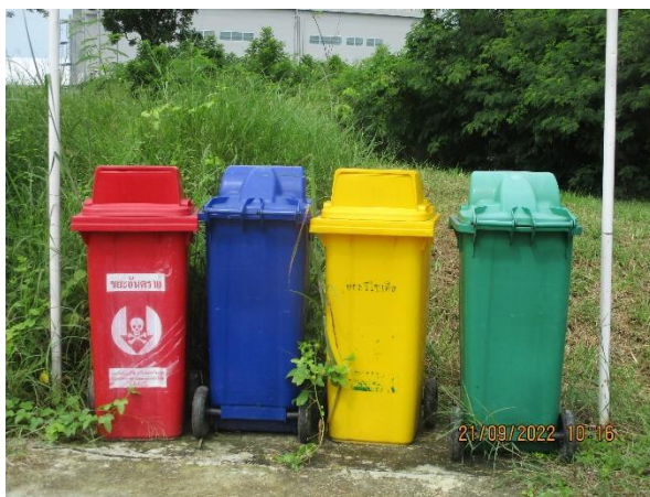
รูปที่ 21 ถังขยะแยกประเภท