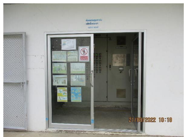
รูปที่ 17 ระบบผลิตน้ำประปา