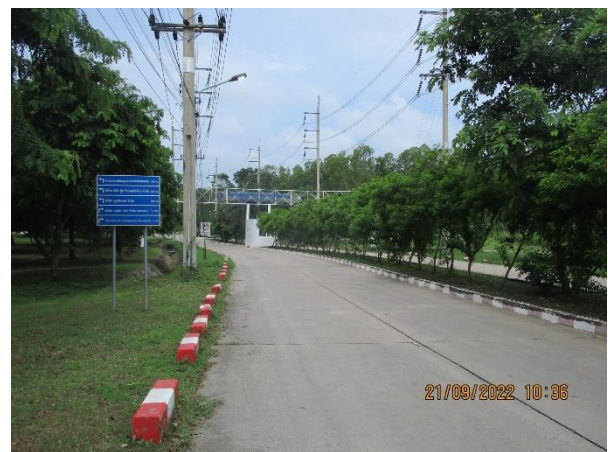
รูปที่ 14 ช่องทางจราจรด้านหน้านิคมฯ