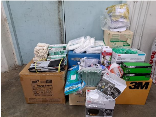
รูปที่ 26 อุปกรณ์ PPE ของโรงงาน