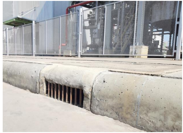
รูปที่ 6 ระบบระบายน้ำฝนของโรงงาน