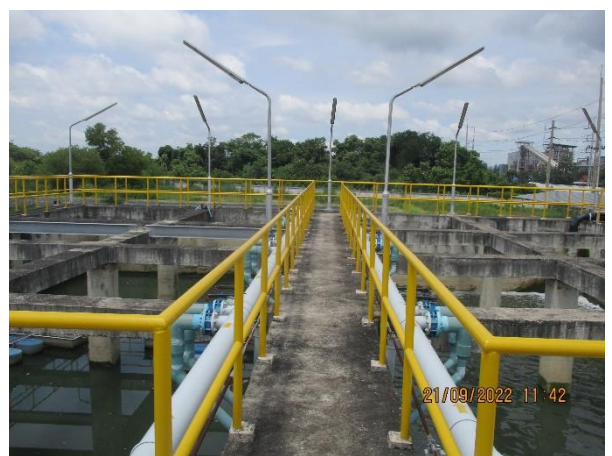
รูปที่ 9 ระบบบำบัดน้ำเสียส่วนกลางของนิคมฯ