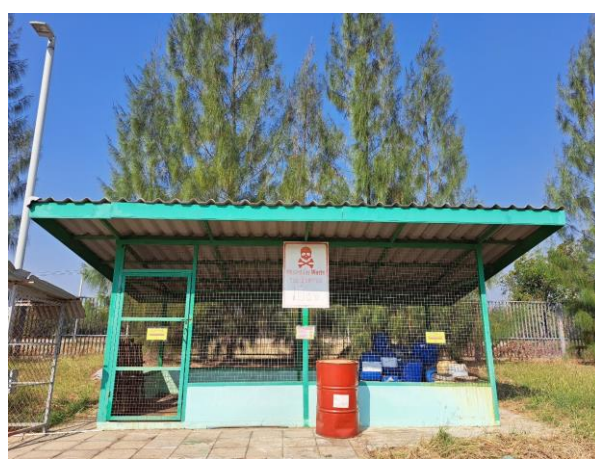
รูปที่ 23 พื้นที่จัดเก็บกากของเสียของโรงงาน