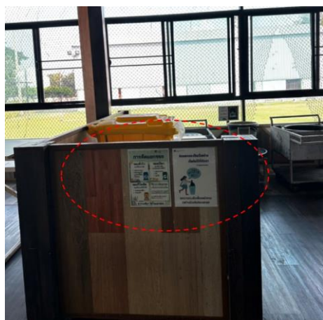
รูปที่ 22 ป้ายรณรงค์การคัดแยกขยะในโรงงาน