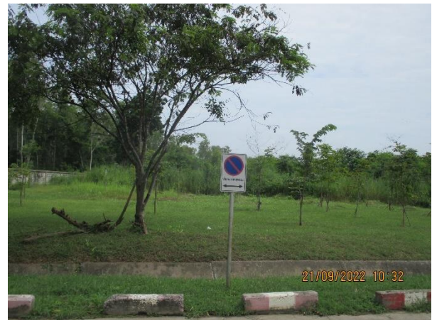
รูปที่ 15 ป้ายเครื่องหมายและป้ายจราจรภายในนิคมฯ (ต่อ)