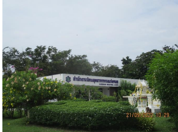
รูปที่ 25 ศูนย์ประสานงานของนิคมฯ