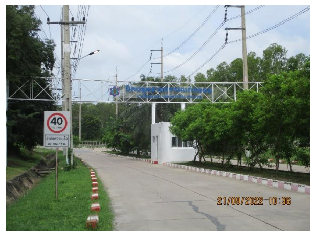
รูปที่ 15 ป้ายเครื่องหมายและป้ายจราจรภายในนิคมฯ