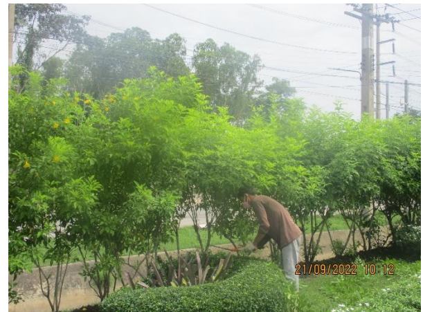
รูปที่ 32 เจ้าหน้าที่ดูแลพื้นที่สีเขียวของนิคมฯ