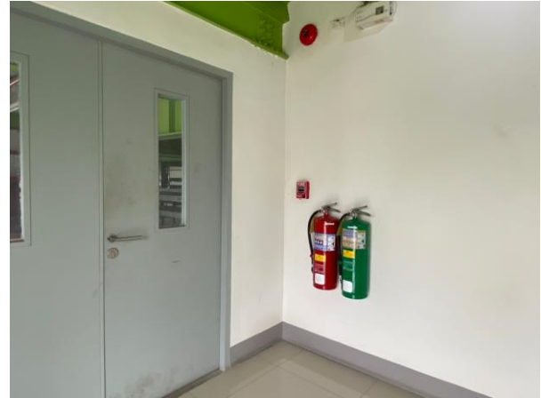
รูปที่ 27 ถังดับเพลิงภายในโรงงาน