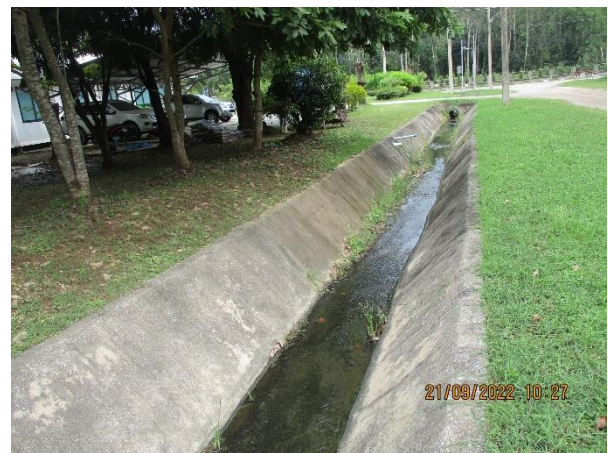
รูปที่ 19 รางระบายน้ำภายในนิคมฯ