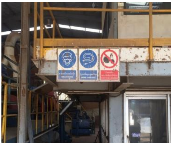
รูปที่ 28 ป้ายเตือนอันตราย บริเวณพื้นที่เสี่ยงภายในโรงงาน