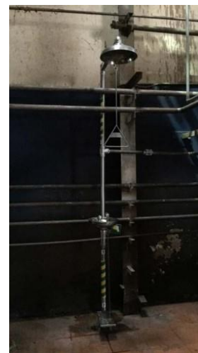
รูปที่ 29 ฝักบัวฉุกเฉิน และอ่างล้างตา บริเวณพื้นที่เสี่ยง