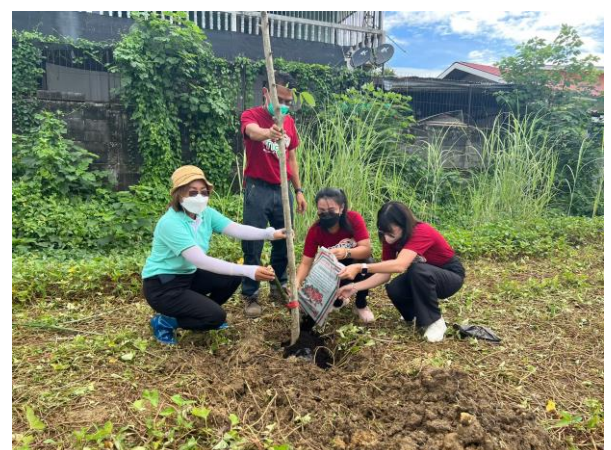
รูปที่ 34 กิจกรรมการปลูกต้นไม้