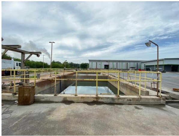
รูปที่ 7 บ่อพักน้ำทิ้งของโรงงาน (Inspection Manhole)