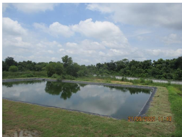
รูปที่ 11 บ่อพักน้ำทิ้งของโครงการ