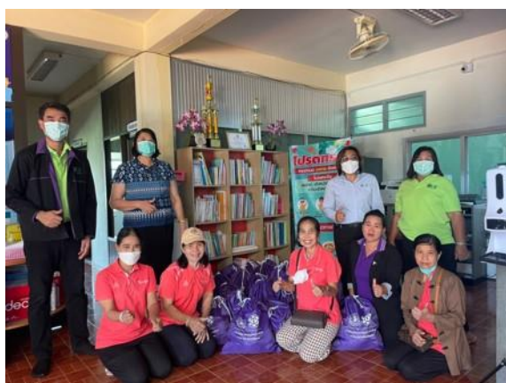
รูปที่ 24 การจัดกิจกรรมมวลชนสัมพันธ์