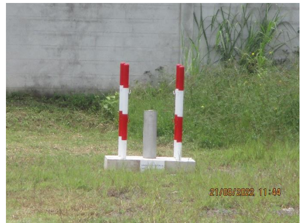
รูปที่ 33 ตำแหน่งตรวจวัดคุณภาพน้ำใต้ดิน