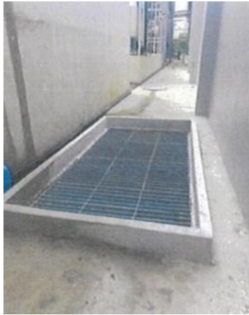
รูปที่ 5 ระบบท่อรวบรวมน้ำเสียของโรงงาน