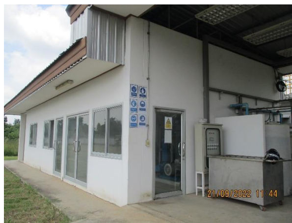
รูปที่ 12 ศูนย์ควบคุมน้ำเสียส่วนกลาง