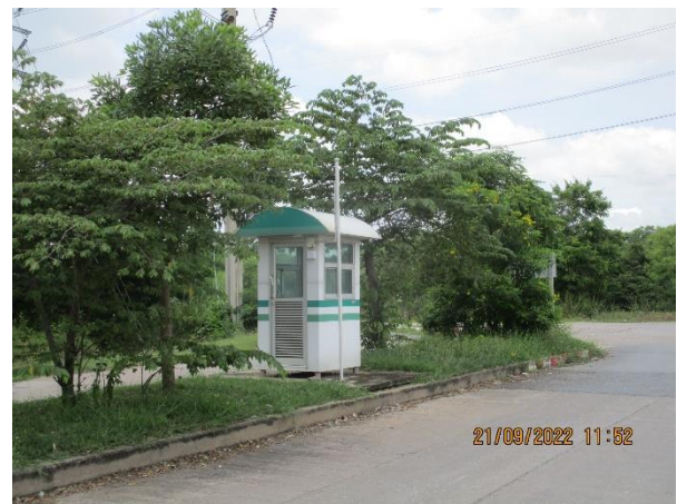
รูปที่ 16 เจ้าหน้าที่รักษาความปลอดภัยภายในพื้นที่นิคมฯ